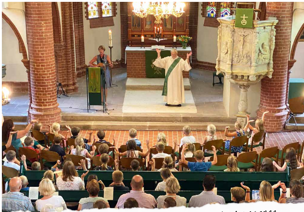
ÖKUM. EINSCHULUNGSGOTTESDIENST IN ST. LUKAS AM 26.08.22